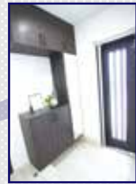
●玄関も収納がたっぷり