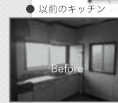
●以前のキッチン ●生まれ変わったカウンターキッチン