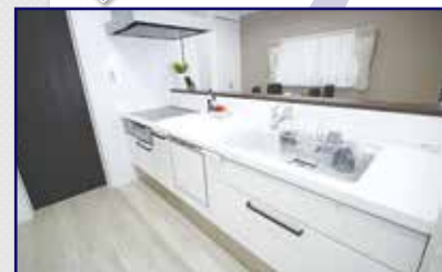
●生まれ変わったカウンターキッチン