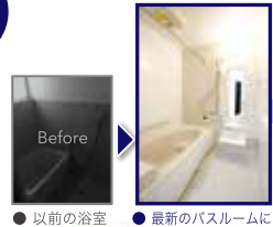
●以前の浴室 ●最新のパスルーム!