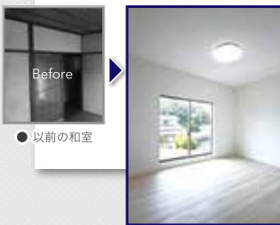
●以前の和室 ●清潔感が漂う洋室へ

土地面積：106.09㎡(32.09坪) 建物面積：85.71㎡(25.93坪)