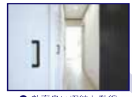
●効率良い収納と動線